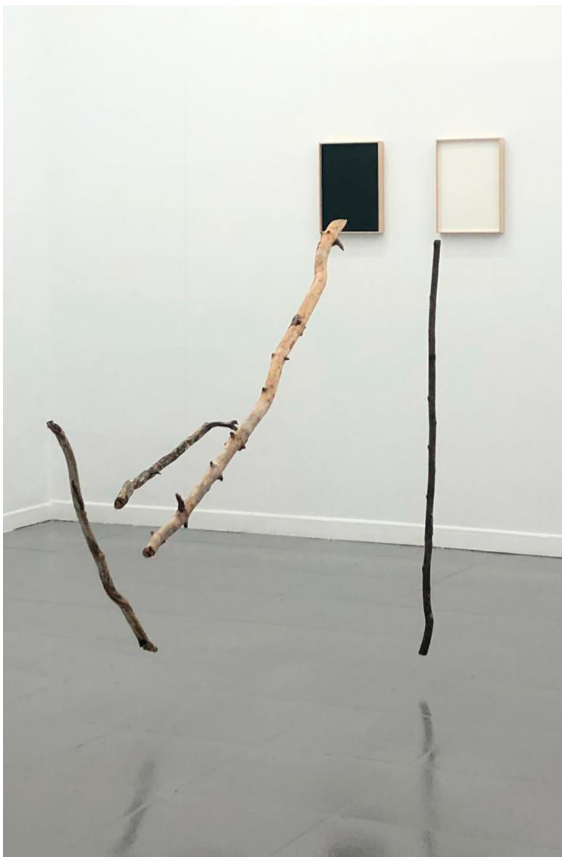
La parábola de los ciegos , 340 x 150 x 140 cm (aprox), instalación de troncos de madera e hilo de nylon, 2020. ed 1/1 3500 euros + IVA