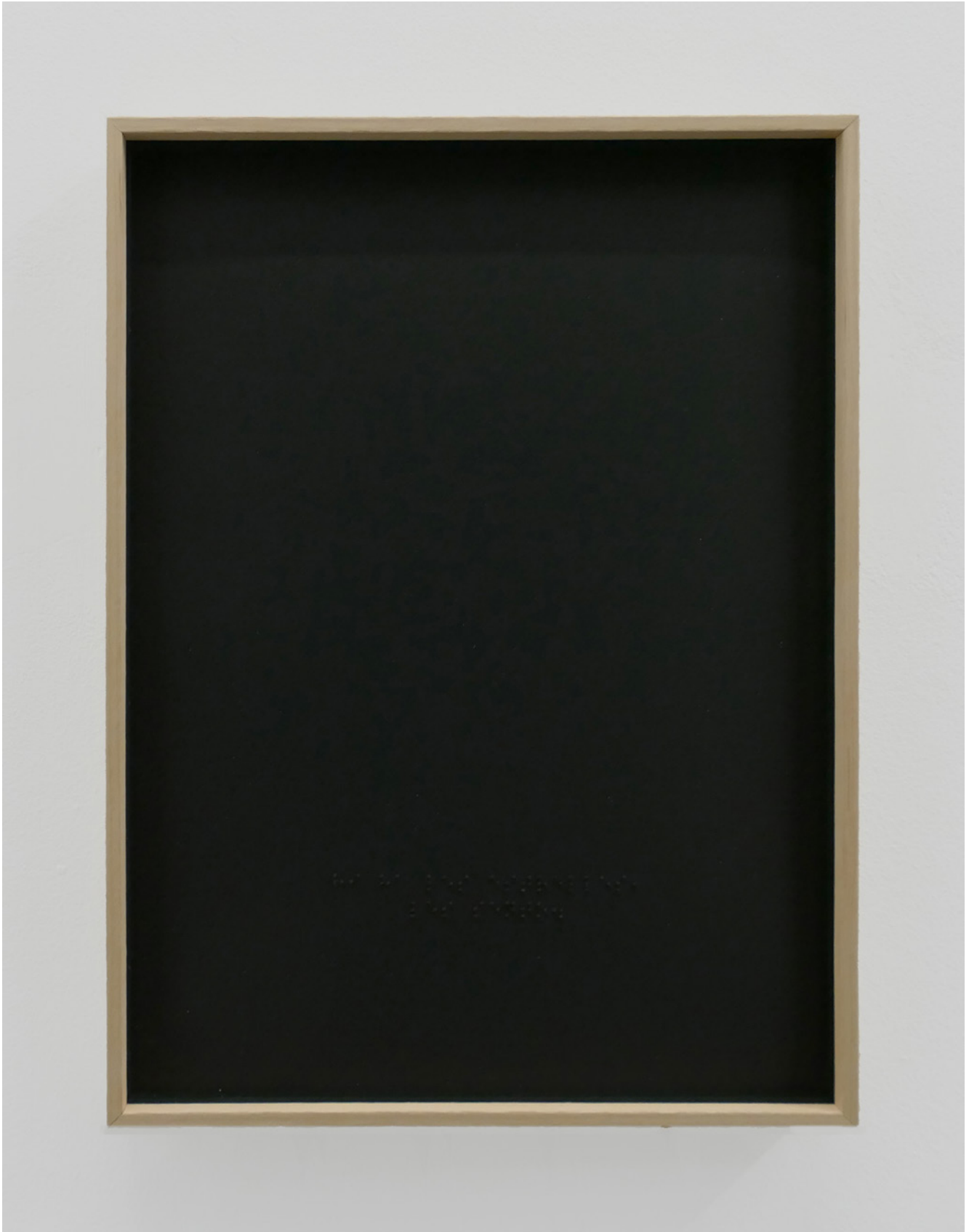
Hi ha les estrelles. Les sento , 42 x 29'7 cm, gofrado sobre papel, 2020 1500 euros + IVA