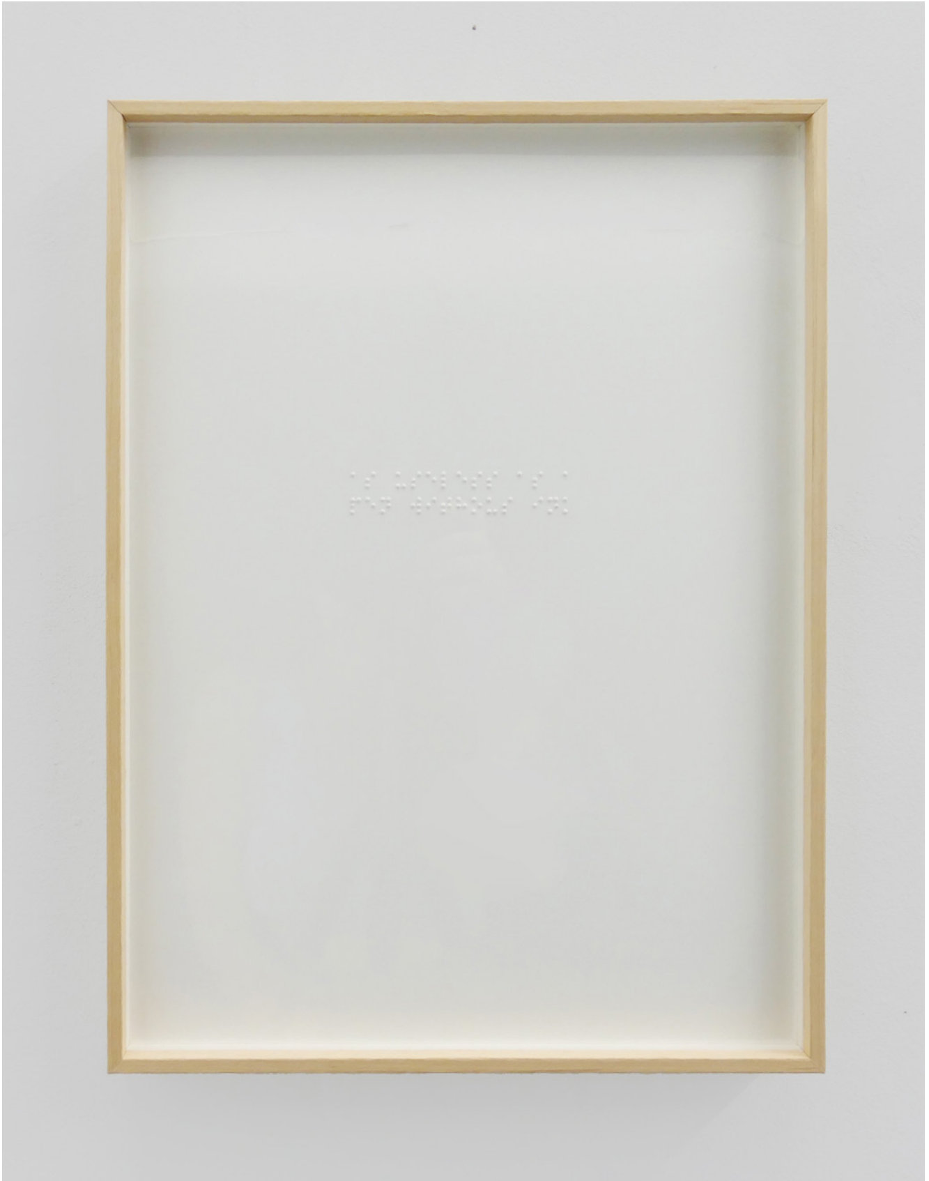
As useless as a pen with no ink , 42 x 29'7 cm, gofrado sobre papel, 2020 1500 euros+IVA