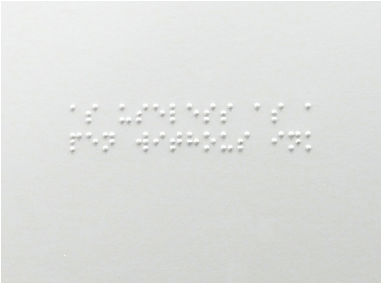
As useless as a pen with no ink (detalle), 42 x 29'7 cm, gofrado sobre papel, 2020