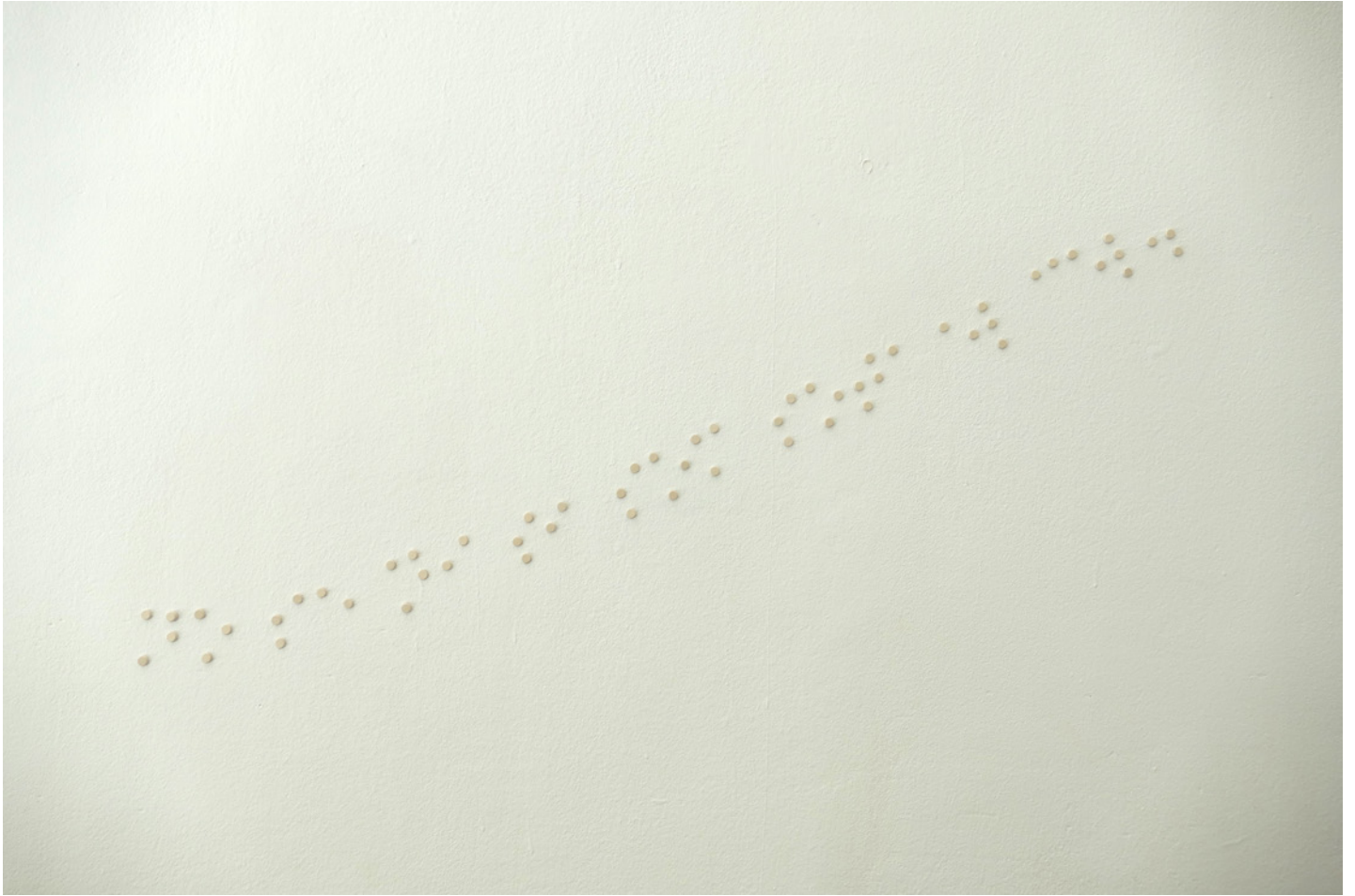
No sé ni si som sota el cel , 100 x 15 cm (aprox), instalación cerámica, 2020 2000 euros + IVA