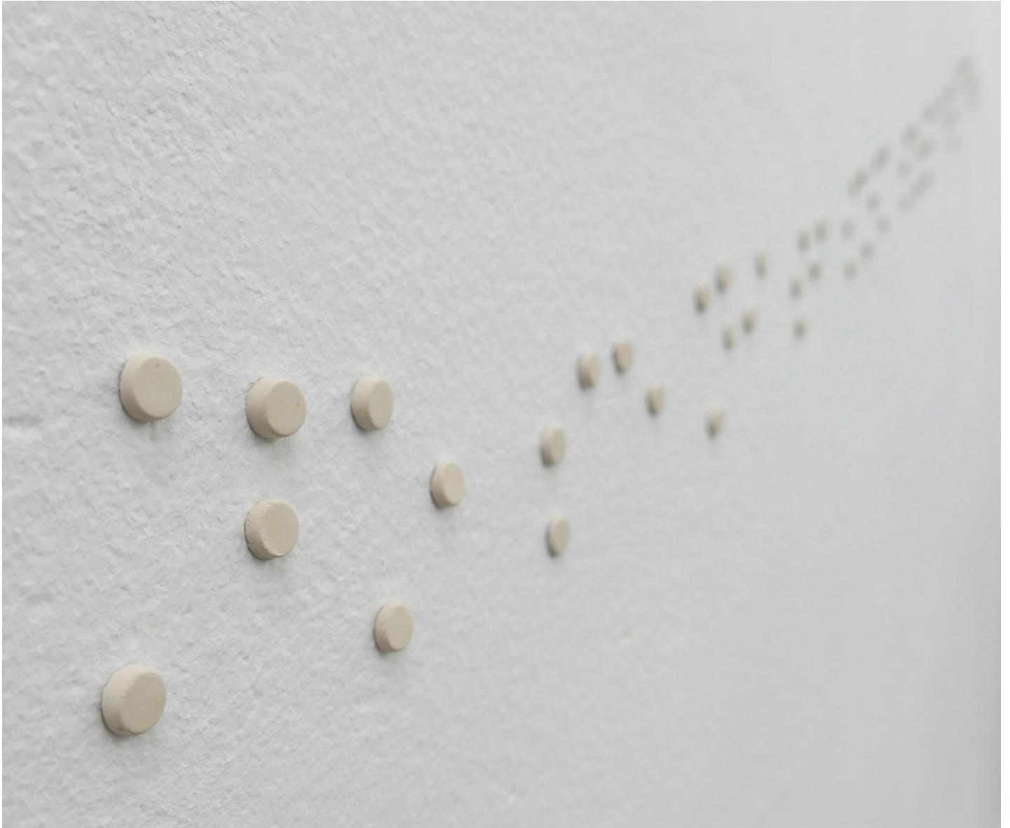
No sé ni si som sota el cel (detalle), 100 x 15 cm (aprox), instalación cerámica, 2020