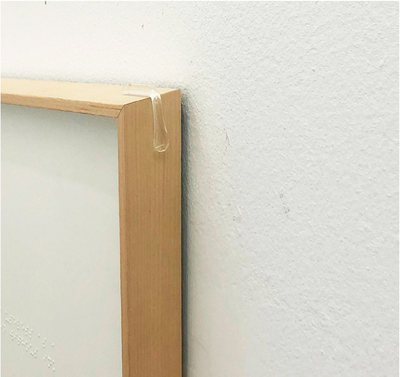
El plor , medidas variables, instalación de múltiples lágrimas de cristal, 2020 2000 euros + IVA(10 lágrimas)