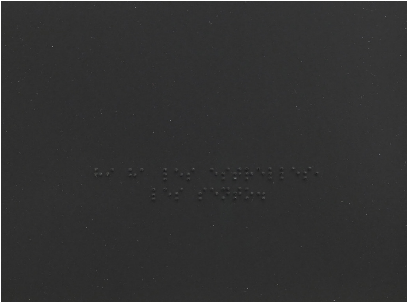
Hi ha les estrelles. Les sento (detalle) , 42 x 29,7 cm, gofrado sobre papel, 2020