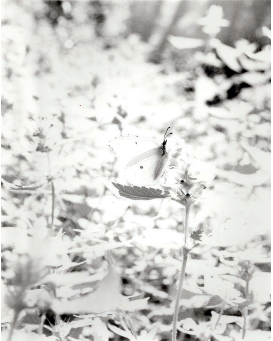
Jochen Lempert, Zitronenfalter , 2023