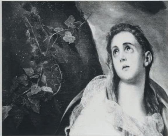
Jochen Lempert, Efeu (El Greco) , 2023