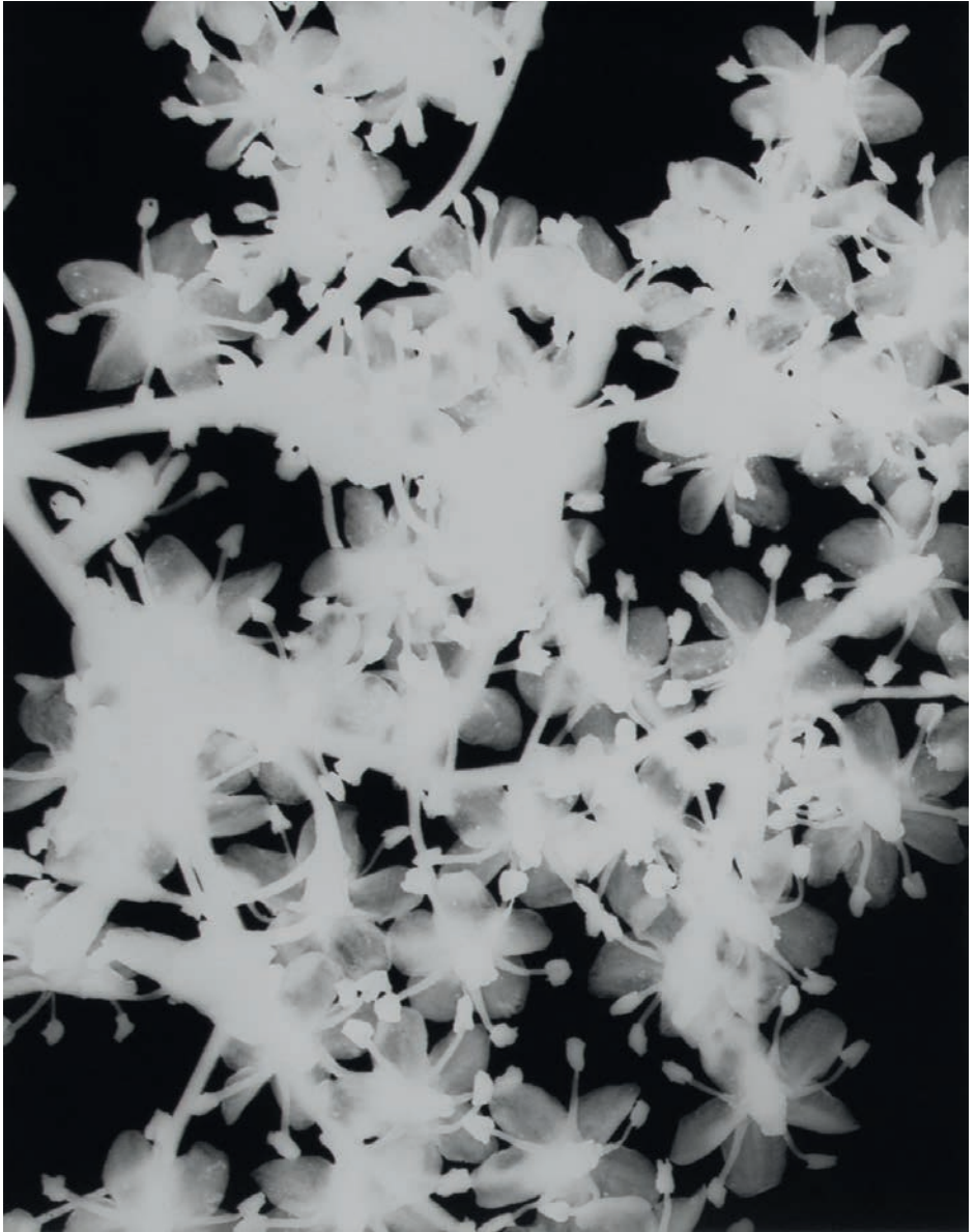
Jochen Lempert, Holunderblüte set (detail), 2023