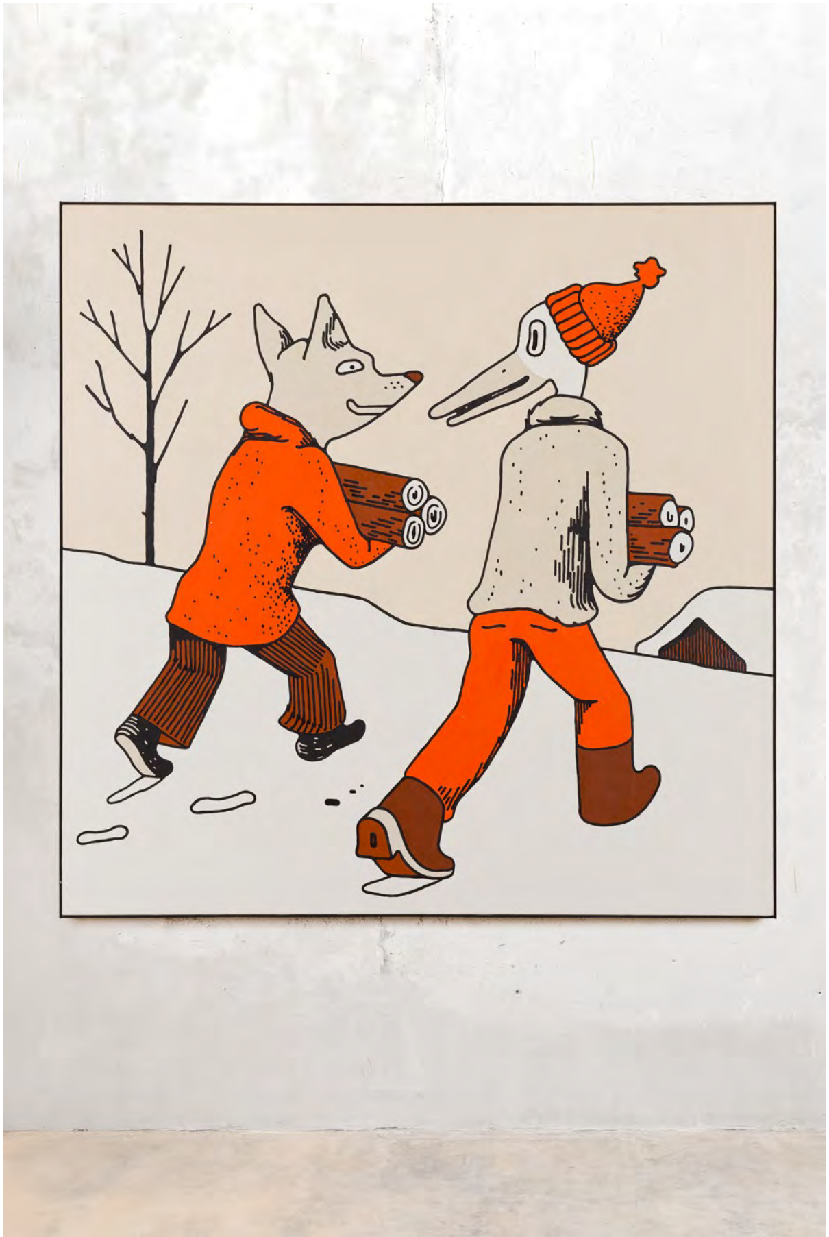
Bringing Some Wood, 2024

Acrylic on canvas. Acrílico sobre lienzo