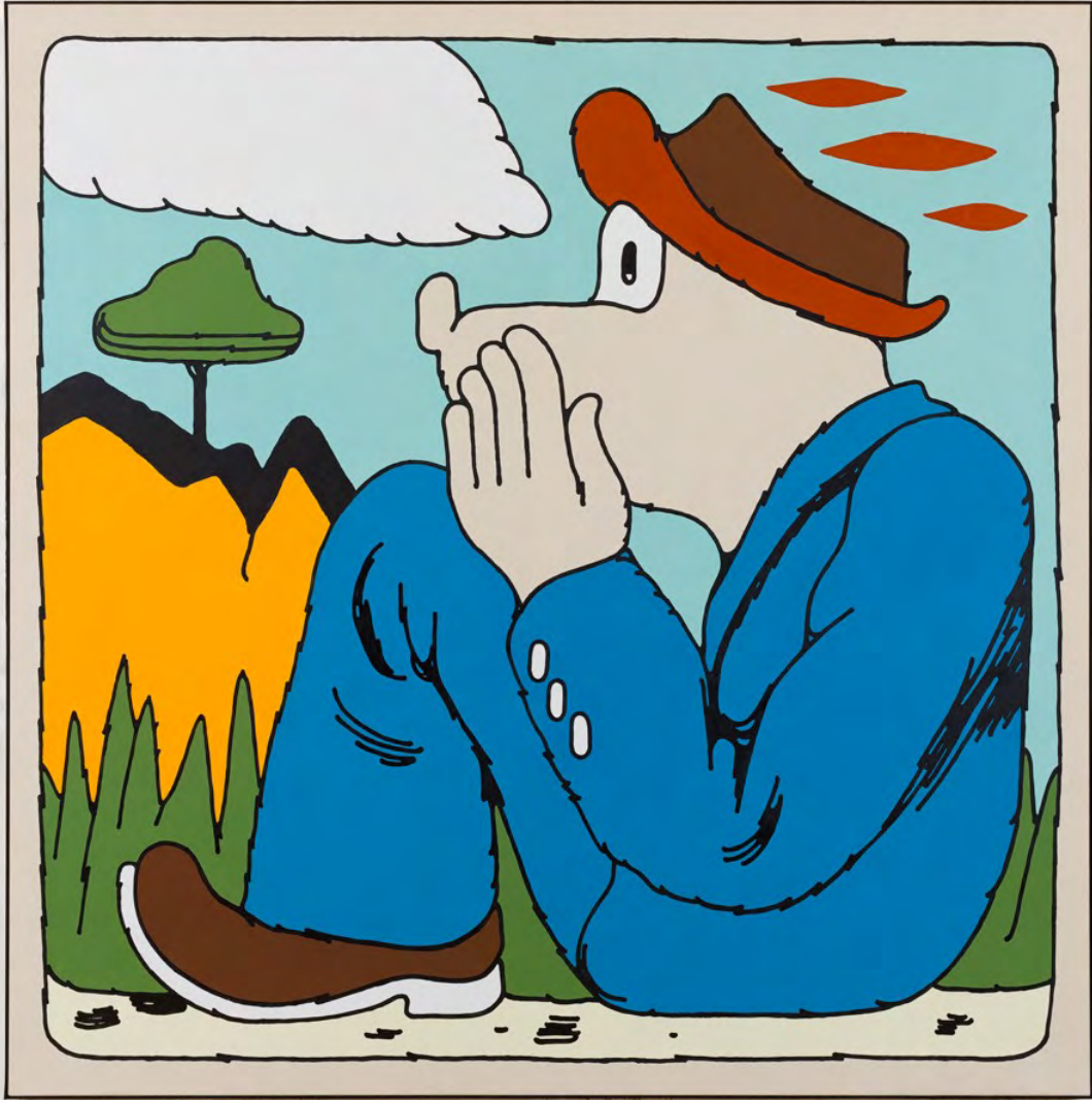
The Whisperer, 2023

Acrylic on canvas. Acrílico sobre lienzo