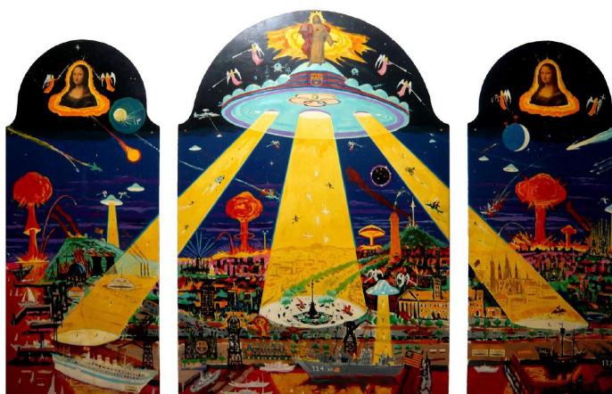
Joan Gelabert [Dalí Júnior] Triptic de Barcelona (visió remota) (1981) Técnica mixta sobre madera 140 x 60 cm (laterales), 150 x 100 cm (central)