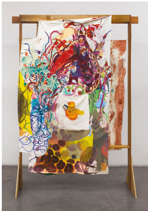
Yamulemau y Yambeque [a la imatge Yamulemau ] 2023-24 240 x 120 cm Acrílic làtex, aplics i brodat sobre tela i llapis sobre paper preparat amb massilla sobre estructura de fusta.

Ha participat en exposicions col·lectives en institucions com la Fondation Cartier pour l'Art Contemporain (París, 2005), el Musée d'Art Contemporain (Lió, 2008), la Casa de América (Madrid, 2010), el Museo Moderno (Buenos Aires, 2012), Malba (Buenos Aires, 2009 i 2011) o la Bienal de Curitiba (Brasil, 2019), entre d'altres. En paral·lel a la seva feina com a artista, el 2006 va iniciar un recorregut en el món de les cures paliatives i el 2010 va cofundar Vergel, una ONG dedicada a entrellagar l'art i la salut, de la qual segueix sent la coordinadora general.