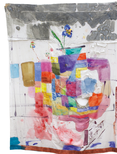
Para el Son y la Salsa, que son fuente de mi alegría Acrílic i brodat sobre tela de cotó