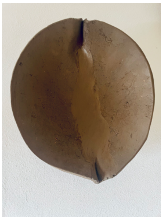
Anna Dot: Libacions, 2025. Cortesia de la galeria.

Punt de trobada: 10:30h, xamfrà entre Centre d'Art Santa Mònica i c/ del Portal de Santa Madrona. Tornada: 14:00h