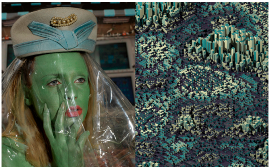
Digital vs físic.

La conversa, moderada per l'equip de la galeria i oberta a la participació dels i les assistents, girarà al voltant del fet de col·leccionar art, com es tria cada adquisició, si hi ha un concepte específic o una motivació concreta, els aspectes tècnics dels processos de compra, com es col·lecciona i alhora s'exposa l'obra digital, i altres qüestions puguin sorgir.