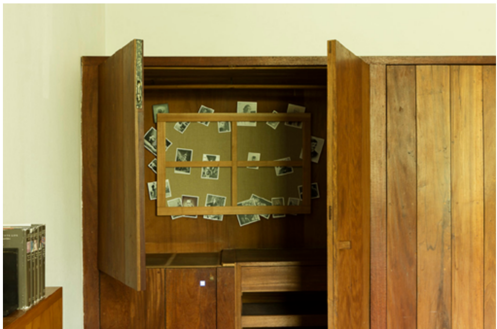
Iñaki Bonillas: Secretos: Men I Love , 2016.

Conversa entre l'artista i el col·leccionista.