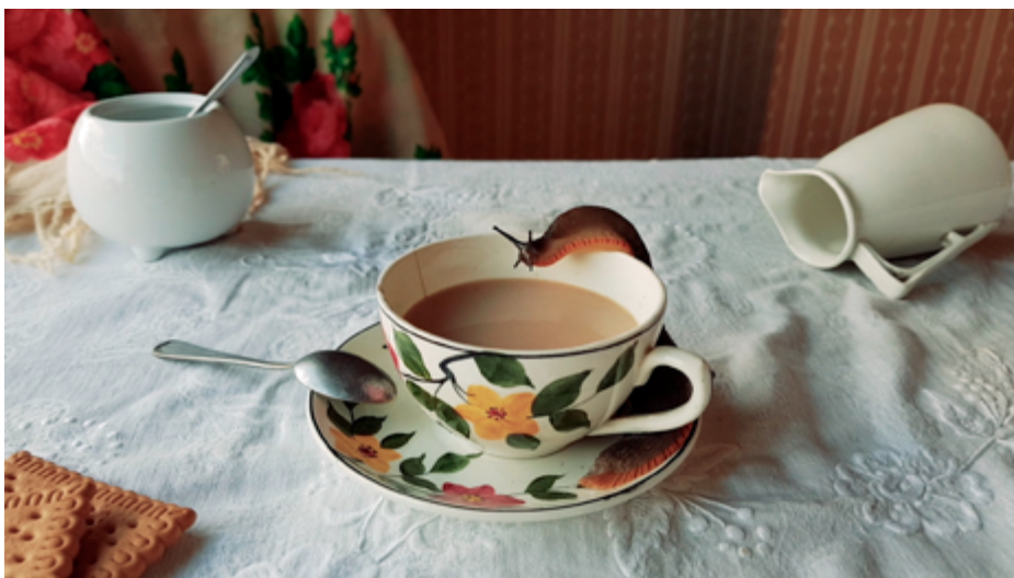
Greta Alfaro: Solitude, 2020. Vídeo monocanal, HD, color, so, 16:9, 24 min. Cortesia de la galeria.

Places limitades. Reserva: suburbiacontemporary@gmail.com