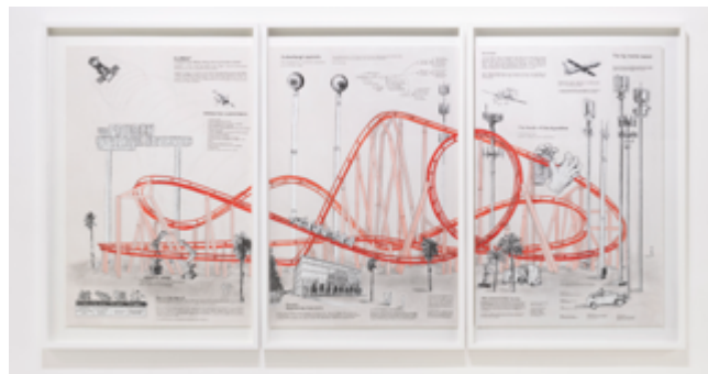
Joan Pallé: The 4th industrial revolution roller coaster, 2022.