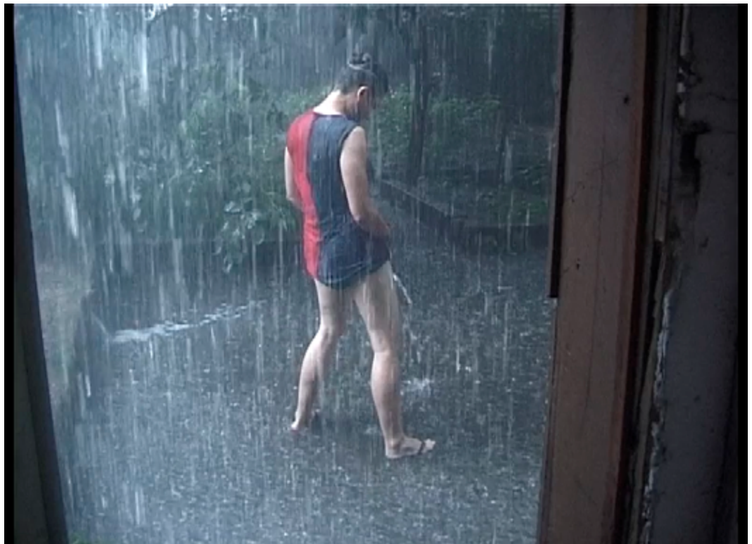
Itziar Okariz: Mear bajo la lluvia, 2019. Cortesia d'ethall.

Comentar aquesta obra de l'artista representada per la galeria ens permetrà exposar i debatre sobre el paper dels diferents actors dins del context de l'art. On ens ubiquem? Quines són les nostres motivacions? Quin paper volem jugar? Fins a on arriba el nostre compromís?