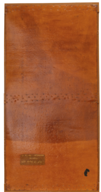
Antón Lamazares. Ay Ay Aiili corazón solo vives un día, (1987/ 2014).

Horarios exposición: 9 y 10.05, 10:00 — 20:00h.